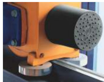
Rolos guia de série na cabeceira superior.