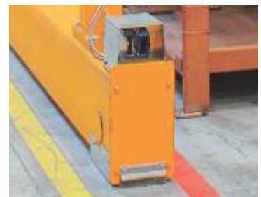
Sem exigência de trilhos sobre o piso.